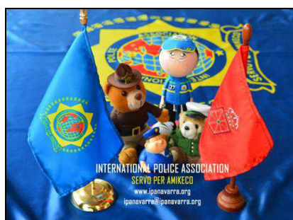
1 er clasificado

Aquí tienes las imágenes con los tres primeros clasificados.