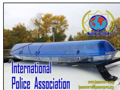
3 er clasificado