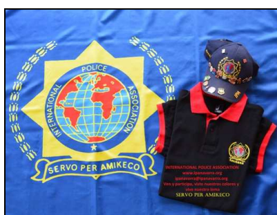
2 o clasificado